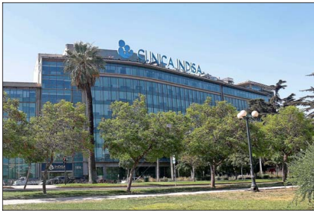
Clínica Indisa será uno de los dos mayores accionistas individuales de CLC, con un 27,8731% de la propiedad.