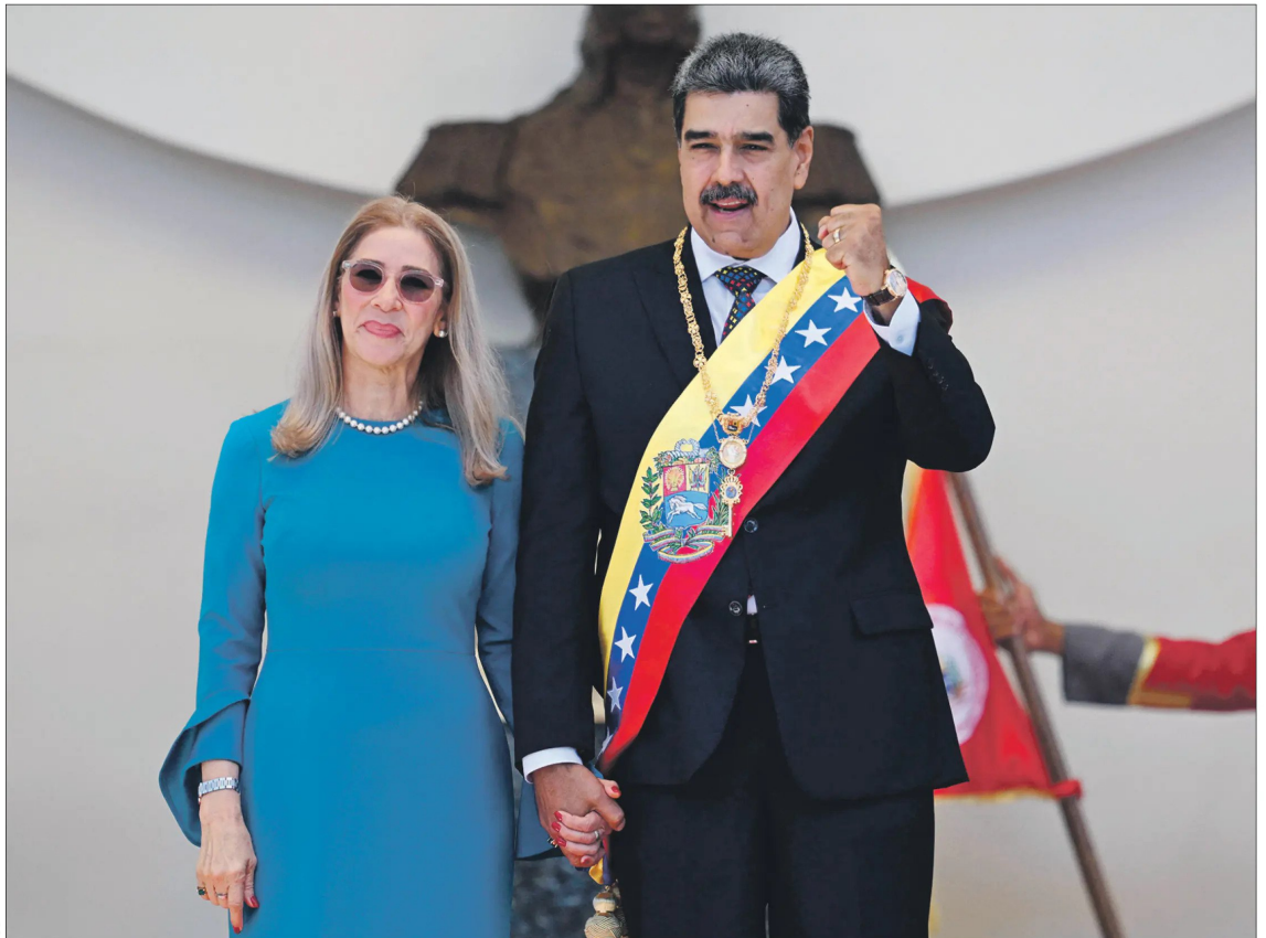
Nicolás Maduro inició este viernes su tercer periodo como presidente de Venezuela.

“Chávez cayó fascinado ante las artimañas del gran embaucador que fue Fidel Castro, quien le hizo creer que sería su heredero como líder de la revolución continental”, agrega.