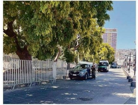
CARABINEROS DISPUSO DE PUNTO FIJO EN EL ÁREA.

"Lo que se hizo en el Congreso Nacional fue una ampliación del perímetro de seguridad. Consiste en afectar solamente la calle Rawson y Victoria, ampliar la malla de contención, para que haya un orden, y por supuesto, co-