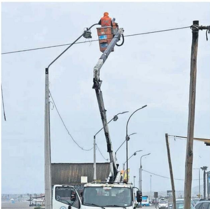
SE REALIZARON LAS REVISIONES CORRESPONDIENTES EN EL TENDIDO DEL SECTOR.

Autoridades llevaron hasta el sector para conocer en terreno las demandas de los locatarios in situ.