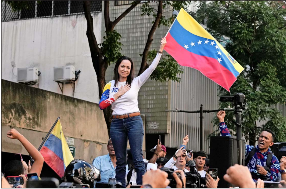
MACHADO aseguró que ahora "comienza una nueva fase" en su país.

El arresto generó una inmediata presión de múltiples países, como España y Argentina, que llamaron a la liberación inmediata de Machado. Luego de que se diera a conocer que estaba en libertad, otros tantos salieron a cuestionar la detención. Entre estos últimos están el gobierno