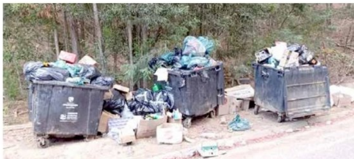
Dicho escenario se presenta desde la semana pasada en algunos sectores de la citada comuna.

El propio edil indicó que en su calidad de autoridad comunal comenzó a recibir registros, tanto fotografías como videos, de