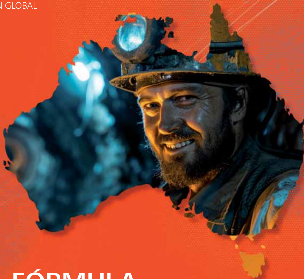
Ilustración: Fabian Rivas