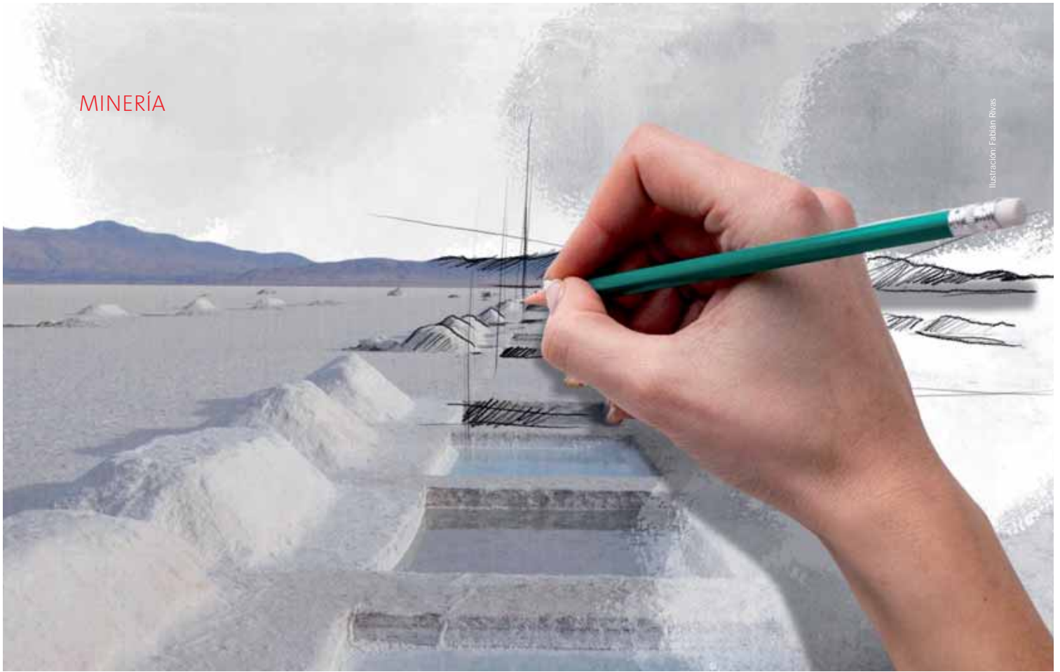
Ilustración: Fabián Rivas