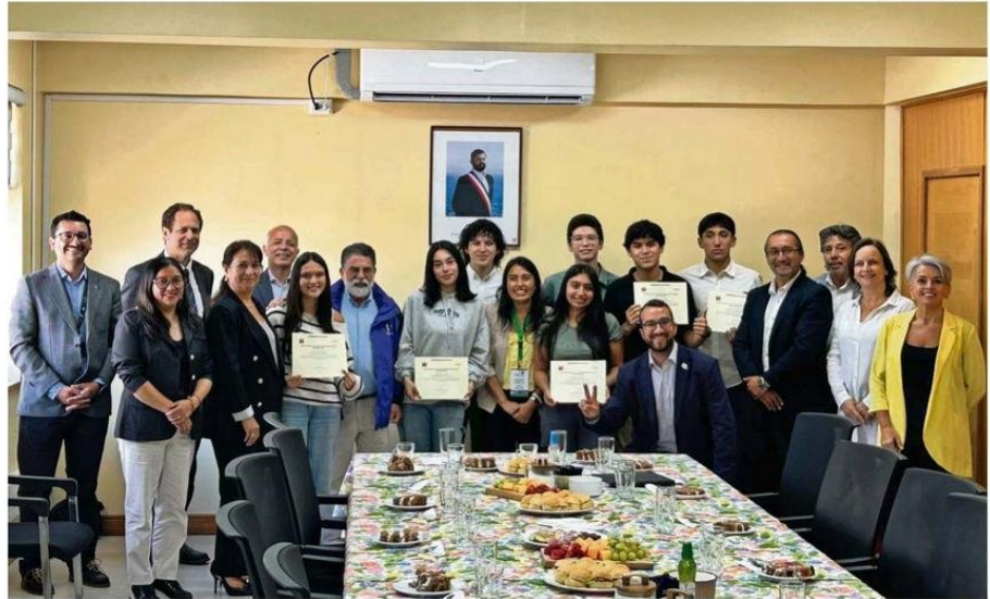
EN EL ENCUENTRO, AUTORIDADES ENTREGARON UN DIPLOMA A CADA UNO DE LOS ESTUDIANTES QUE LOGRARON LA DISTINCIÓN A LA TRAYECTORIA EDUCATIVA.

En tanto, acerca de sus resultados, contó que para la única prueba que estudió fue para la de Historia, "y fue en la que me fue peor de las tres. Es curioso eso, y creo que tiene que ver con que la gente tiene más facilidades para ciertas cosas y cada quien tiene su forma de estudio. De hecho, me sorprendió que me haya ido tan bien en la