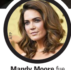
Mandy Moore fue una de las actrices evacuadas.

Hasta ayer, el incendio había consumido más de mil 200 hectáreas en el sur de California y estaba fuera de control.