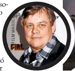
Mark Hamill reside en Malibú.