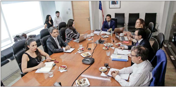
El Comité de Ministros, compuesto por subrogantes, rechazó ayer nuevamente el proyecto Dominga.