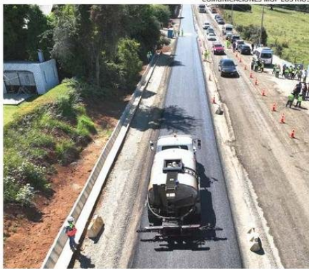
EL MEJORAMIENTO VIAL SERÁ OTRO DE LOS EJES DE DESARROLLO EN LA ZONA.

Vialidad cuenta con una cifra superior a los 190 mil millones, y entre los principales proyectos para este año se cuenta la construcción del nuevo puente Collileftu en Los Lagos, con presupuesto de 15.345 millones de pesos; el asfaltado de la Ruta Valdivia-La Unión (Camino Viejo a La Unión) en su etapa 2, con 24 mil millones de pesos; el mejoramiento del camino entre Rupumeica Alto y Rupumeica Bajo en Lago Ranco, que se ma-