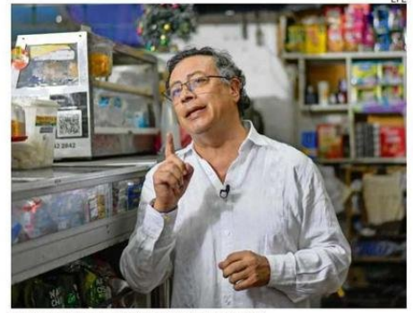
EL PRESIDENTE DE COLOMBIA, GUSTAVO PETRO.