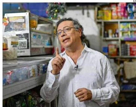
EL PRESIDENTE DE COLOMBIA, GUSTAVO PETRO.