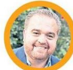
Sergio Giacaman, Gobernador Regional del Biobío

El Biobío vivió este martes el inicio de un nuevo ciclo con el primer día oficial de Sergio Giacaman en su cargo como Gobernador Regional. Una primera jornada cargada de actividades, papeleo administrativo y un corto espacio para socializar con la gente de Concepción.