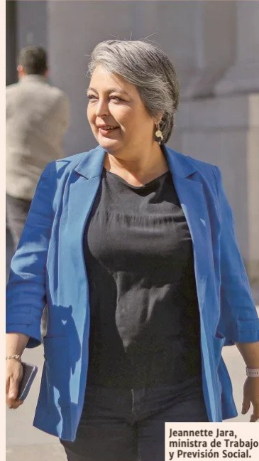
Jeannette Jara, ministra de Trabajo y Previsión Social.