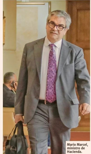
Mario Marcel, ministro de Hacienda.

vo y la oposición? La situación se enredó luego de que este lunes el Presidente Gabriel Boric subiera duramente el tono en contra de la derecha, acusándolos de no ceder y que hay quienes insisten en que una parte mayoritaria de la cotización adicional de 6% debiera ir a cuentas individuales.