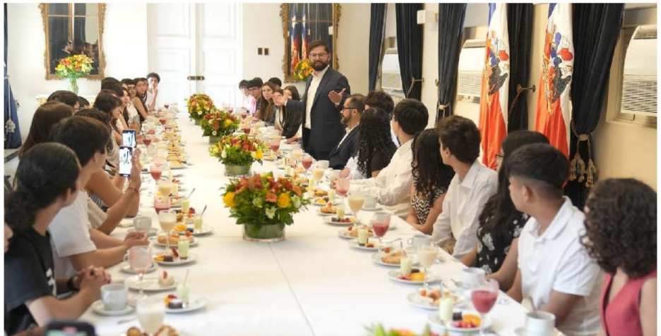
EL PRESIDENTE GABRIEL BORIC se reunió con los puntajes máximos de la PSU en el Palacio de la Moneda.

Desde Diario La Tribuna se intentó contactar con todos los destacados de la provincia, quedando algunos de ellos sin localizarlos o sin entregar respuesta al medio de comunicación.