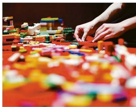
DOCUMENTO COMPLETO ESTÁ EN EL SITIO WEB DE LA DEFENSORÍA.

Considerando lo anterior, las cifras señalan que