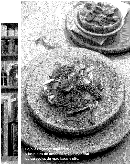
Bajo las alas desmenuzadas y las pieles de pescado hay un mariscal de caracoles de mar, lapas y ulite.