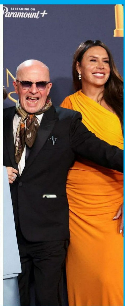
► Los actores Demi Moore, Timothée Chalamet, y el director Jacques Audiard junto a la actriz Karla Sofia Gascón.