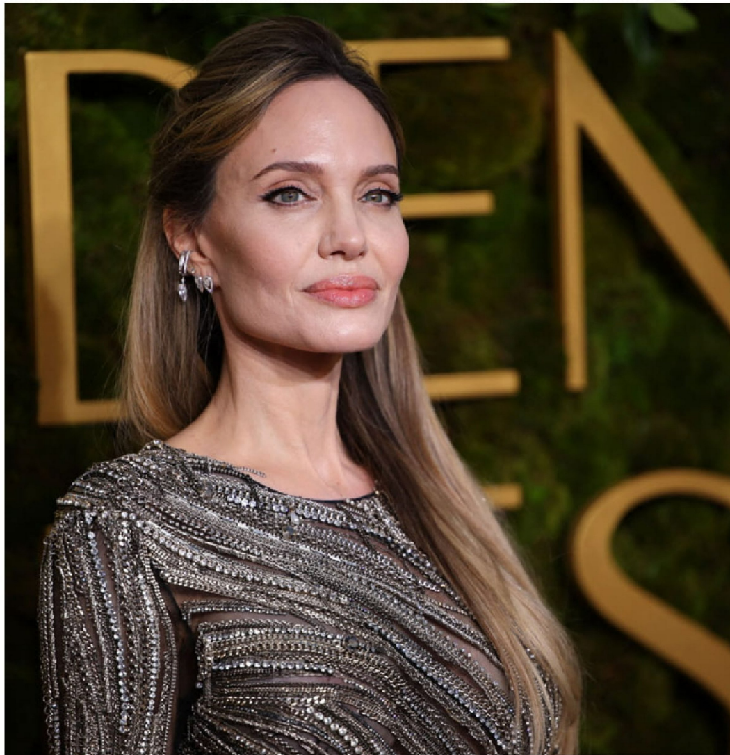
► La actriz Angelina Jolie se perfilaba como una de las favoritas para conquistar el galardón a Mejor actriz de drama.

Los Oscar revelarán a sus nominados el próximo 17 de enero. En tanto, la ceremonia se desarrollará el 2 de marzo. ●