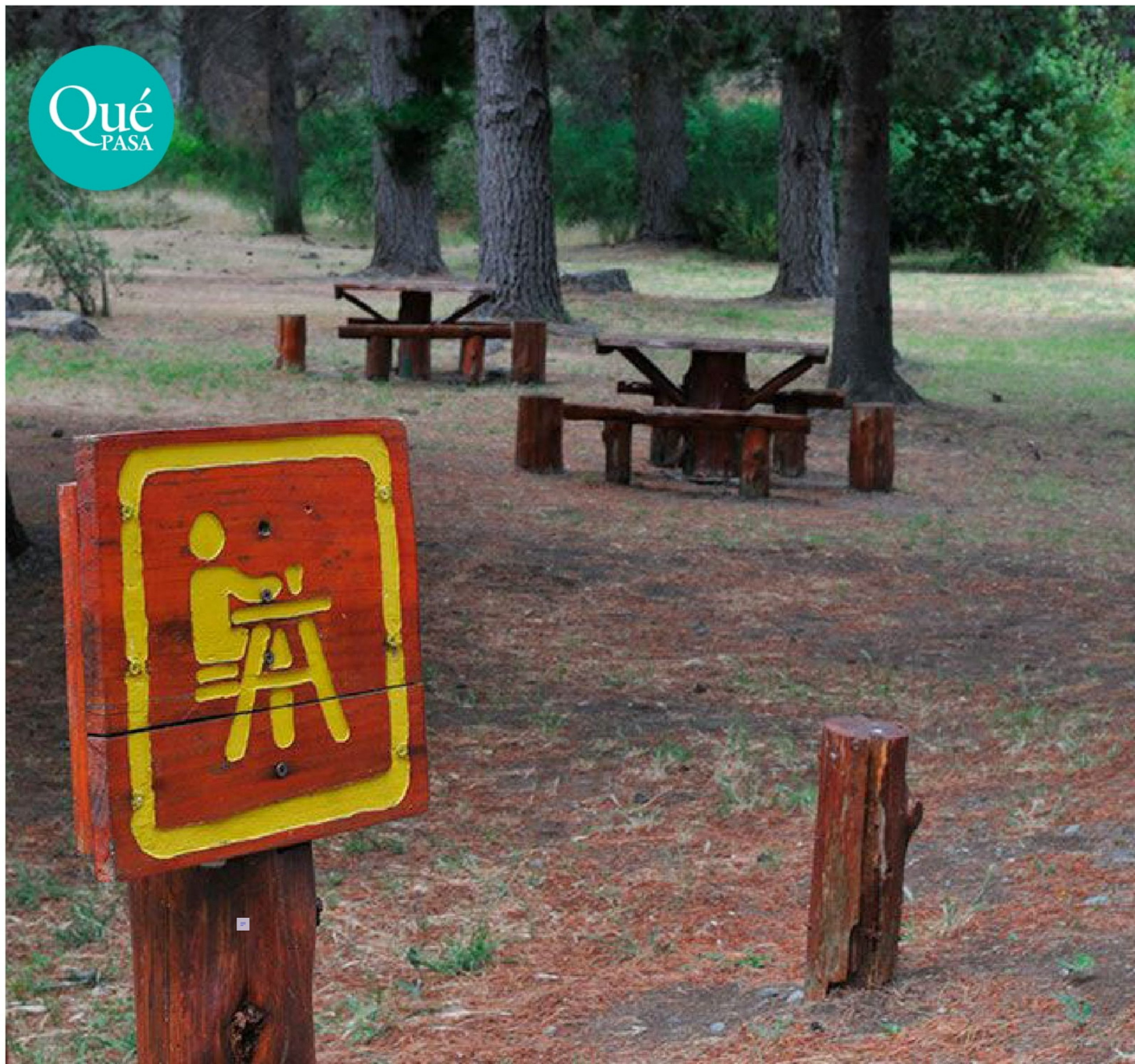
► Durante el verano, debido a las altas temperaturas y la temporada de vacaciones, se producen desplazamientos de personas a zonas donde habita el roedor.