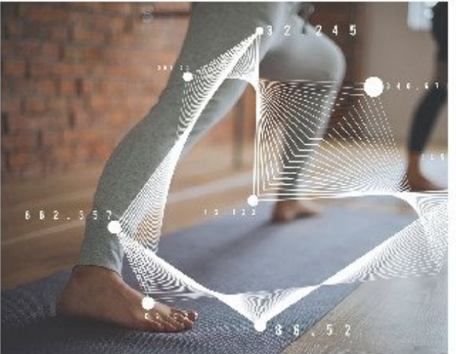
La IA ayuda a optimizar el ejercicio físico.