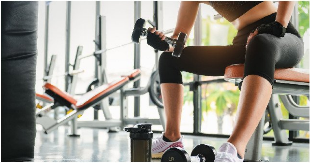
Entrenamiento físico.

Las prácticas de autocuidado holístico han sido una gran prioridad durante 2024, se han vuelto esenciales para ayudar a reducir el estrés, reforzar la inmunidad, mejorar la claridad mental general y aumentar el bienestar emocional; y se prevé que las búsquedas en línea sobre este tema aumenten significativamente en 2025, según esta misma fuente.