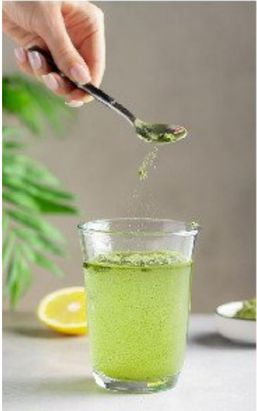
Suplemento alimenticio.