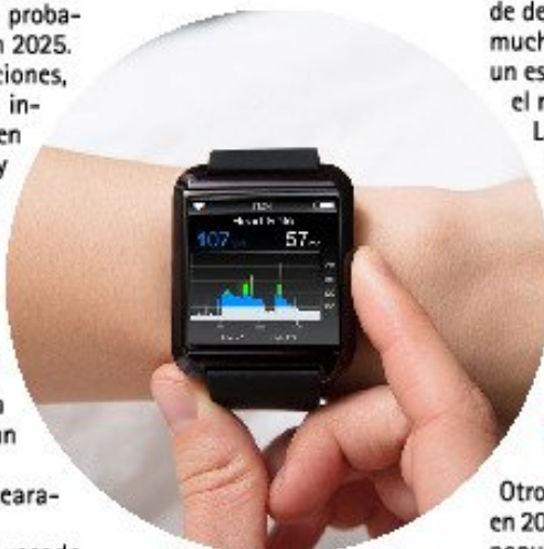
Reloj Inteligente.

Algunas prácticas como los baños de sonido (de gongs, diapasones y cuencos de cristal), la meditación y las terapias de frío y calor están ganando terreno, como parte del enfoque holístico, que considera al cuerpo y la mente como un todo en vez de algo separado, y que la salud física y el bienestar mental y emocional de una persona está vinculados, según LFT.