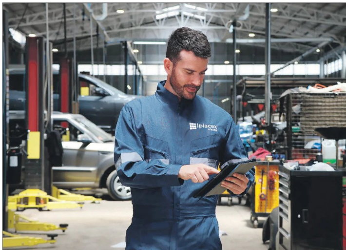
Un mecánico actualizado trabaja principalmente con sistemas electrónicos.

"Es una carrera versátil y con oportunidades en sectores tan diversos como minería, agricultura, comercio, turismo, transporte portuario y aeroportuario, almacenaje, abastecimiento y más. Los técnicos tienen una empleabilidad de 95,3% y un ingreso promedio de $863.500 al primer año. Los ingenieros tienen un sueldo de $1.238.000 al primer año de egreso".