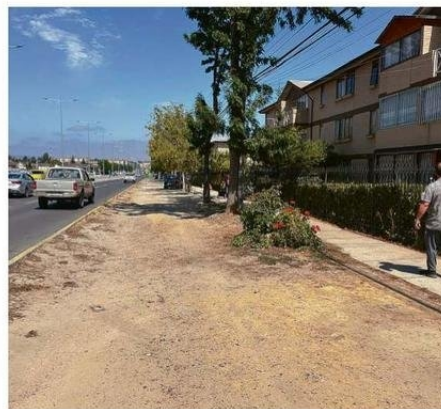
ESTA ES LA IMAGEN AHORA DE LAS VEREDAS DE CALLE CENTENARIO.

"Nosotros desde el día uno hemos interceptado e intervenido lugares que son de alto tráfico, sobre todo en la Feria del Belloto,