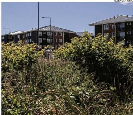
LA GRAN CANTIDAD DE VEGETACIÓN ES LA PRINCIPAL DIFICULTAD.

años venden droga en la calle Alonso de Ercilla en la población Juan Pablo Segundo de Mirasol.