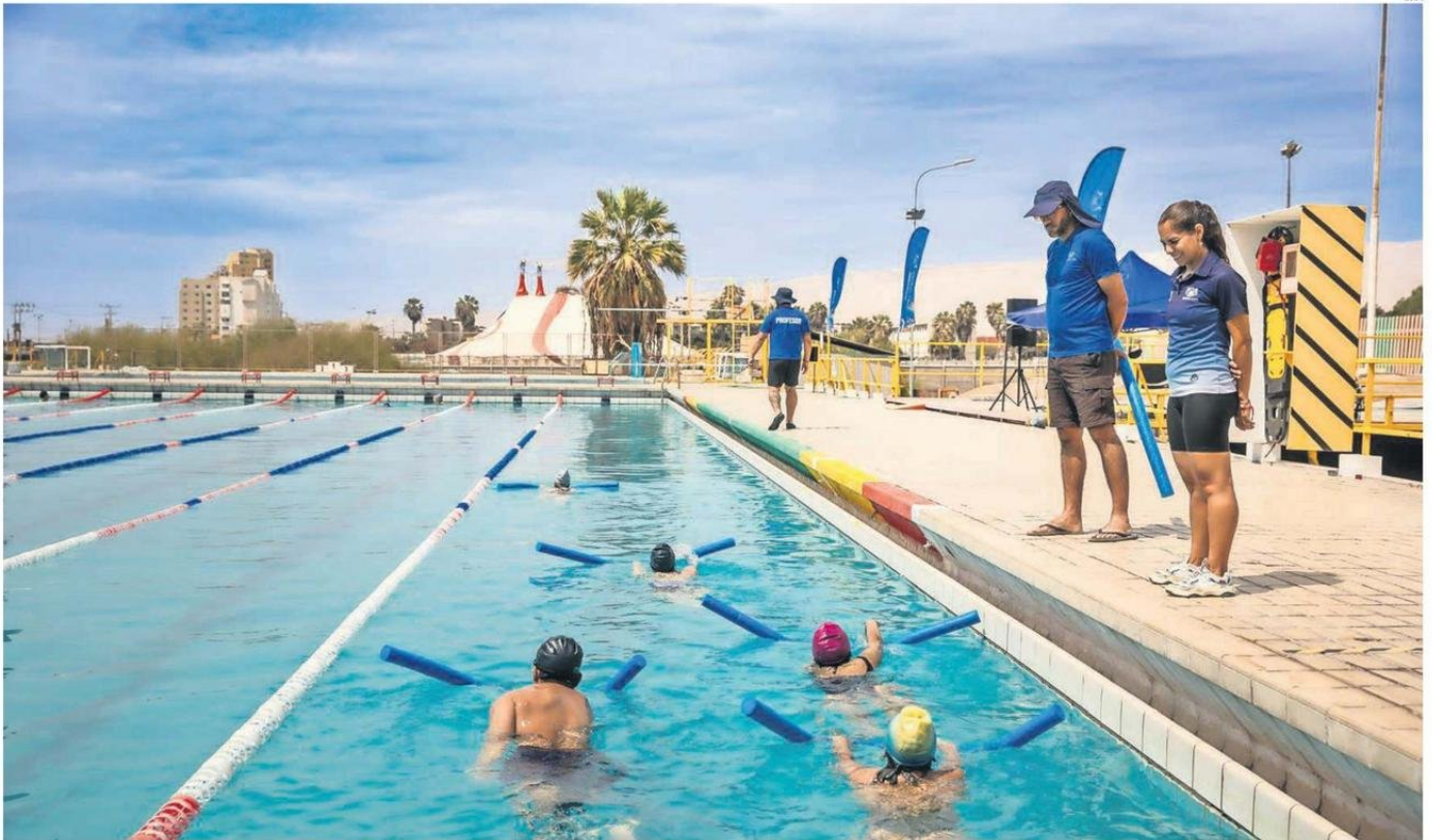
LOS ASISTENTES EN CONJUNTO DE SUS PADRES Y PROFESIONALES, TOMAN SUS CLASES DE NATACIÓN EN LA PISCINA OLÍMPICA DE MANERA GRATUITA.