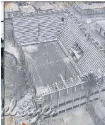
EL SOKOL DESDE EL AIRE. EL ESTADIO SIN SU TECHUMBRE.

Periodista e investigador antofagastino Isidro Morales