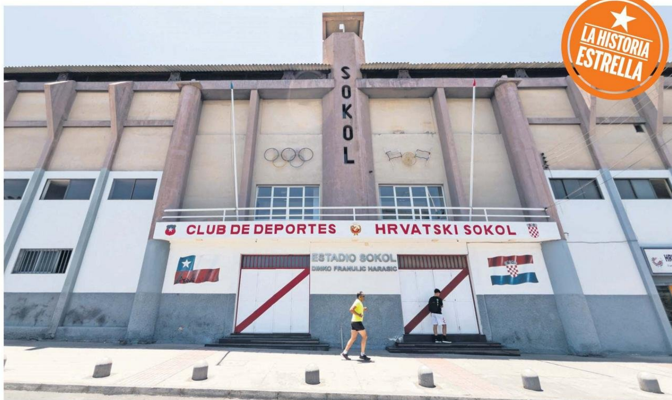
EL MÍTICO ESTADIO SOKOL DE ANTOFAGASTA. RECINTO HISTÓRICO DE LA CIUDAD QUE HA VISTO GRANDES Y ÚNICOS MOMENTOS DEPORTIVOS, ARTÍSTICO Y DE TODO ÍNDOLE. ORGULLO ANTOFAGASTINO.