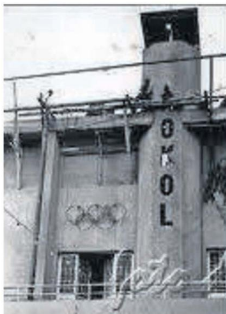
FOTOS HISTÓRICAS, ÚNICAS DE SU CONSTRUCCIÓN.