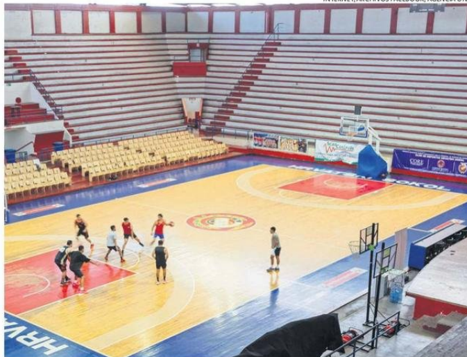
EL RECINTO HOY, UBICADO EN EL CORAZÓN DE LA CIUDAD, RECIBIENDO TODO TIPO DE EVENTOS.