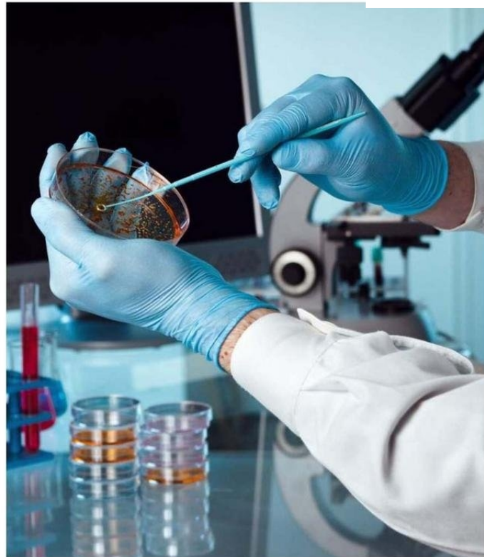
LAS INICIATIVAS ADJUDICADAS ABARCAN TODAS LAS ÁREAS DEL CONOCIMIENTO, PRIORIZANDO LA GENERACIÓN DE NUEVOS CONOCIMIENTOS O APLICACIONES, EN BASE A HIPÓTESIS EXPLÍCITAS PRESENTADAS EN LAS PROPUESTAS.

Reiterando su liderazgo como referente en investigación y tecnológica en Chile, investigadoras e investigadores jóvenes obtuvieron la adjudicación de diez proyectos Fondecyt de Posdoctorado 2025. Gracias a estos logros, la Ufro