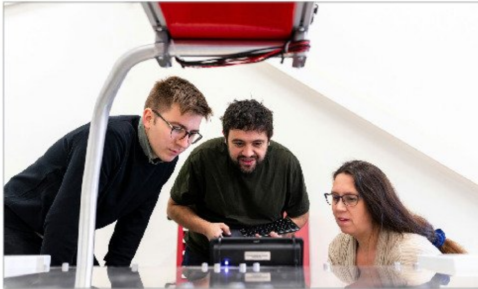
Investigadores trabajando con un dispositivo experimental.

"El auge de máquinas impulsadas por IA, que imitan los comportamientos humanos, desafiará nuestra forma de entender el liderazgo, la responsabili-