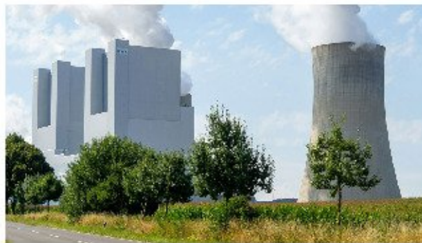
La creciente demanda energética e informática impulsará una nueva era de la energía nuclear.

Para 2025 destaca como objetivo principal la energía nuclear, que está situándose como una prioridad en la agenda empresarial, impulsada por la necesidad de contar con fuentes de energía limpias, sostenibles, fiables y controlables que puedan soportar las crecientes demandas energéticas de la IA y otras tecnologías de alto consumo energético, según Capgemini. En ese sentido se espera que en 2025 se acelere el desarrollo de los reactores modulares pequeños (SMR) y la tecnología de la fusión nuclear, y se produzcan otros avances en dirección hacia la producción ilimitada y limpia (no contaminante) de