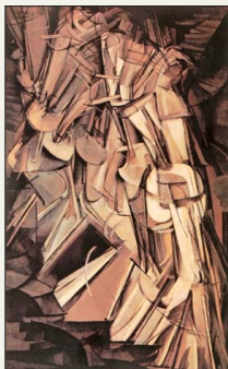
“Nudo bajando una escultura n°2”, 1912, de Marcel Duchamp.