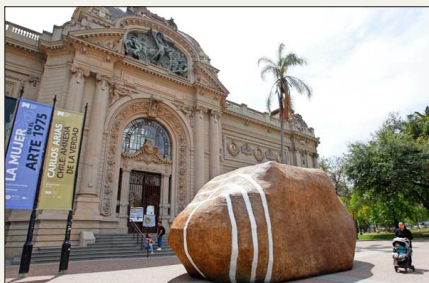
Una roca en el lugar de la escultura “Unidos en la gloria y la muerte”, de Rebeca Matte, frente al Bellas Artes. Era “Palabras mayores”, 2023, de Enrique Matthey.

“Si se analiza el nuevo estilo se halla en él ciertas tendencias sumamente conexas entre sí”, escribió Ortega. “Tiende: 1º, a la deshumanización del arte; 2º, a evitar las formas vivas; 3º, a hacer que la obra de arte no sea, sino obra de arte; 4º, a considerar el arte como juego, y na-