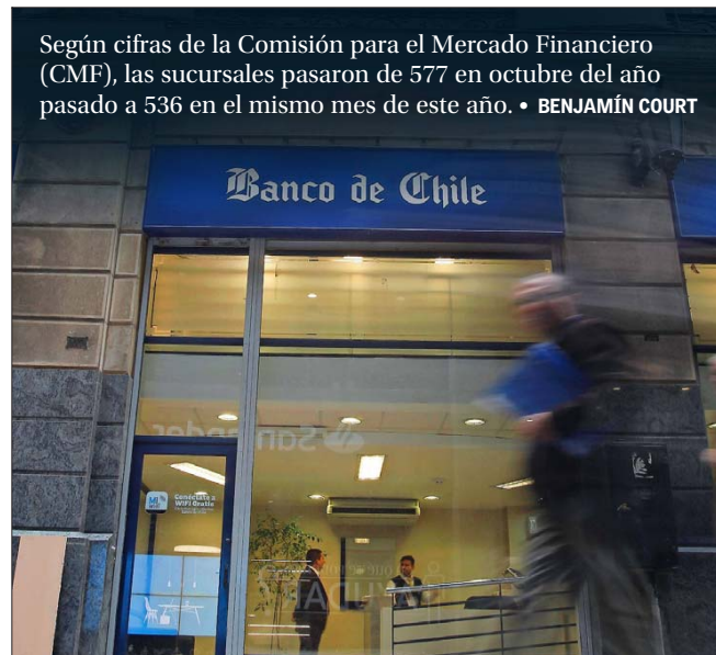
El Banco de Chile lidera la lista de cierres de sucursales durante 2023 y hasta octubre pasado.

mientos de los clientes, sin la necesidad de asistir presencialmente a una oficina.