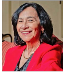
Rosanna Costa, presidenta del Banco Central y ex Directora de Presupuestos.