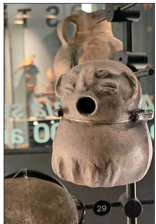
Figura antropomorfa de la cultura Pitirén que se puede ver en el Museo de Historia Natural de Concepción.