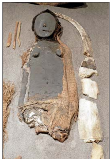
En el Museo San Miguel de Azapa se pueden ver las momias Chinchorro, las más antiguas del mundo.