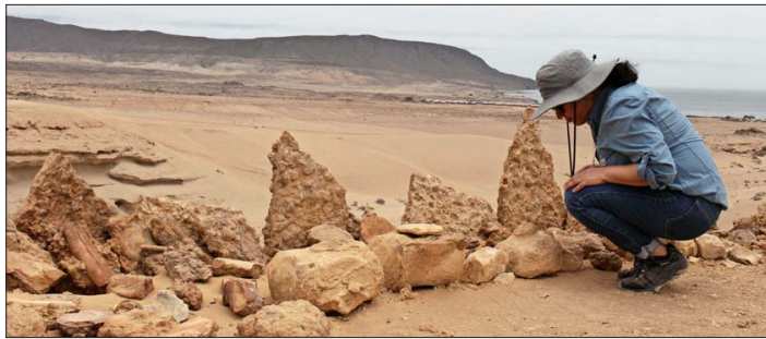
En el Parque Paleontológico Los Dedos, los visitantes pueden recorrer los senderos y encontrar evidencia fósil de los animales que ahí vivieron.