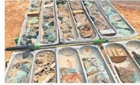
LA MINERA ESTÁ EMPLAZADA EN MEJILLONES.