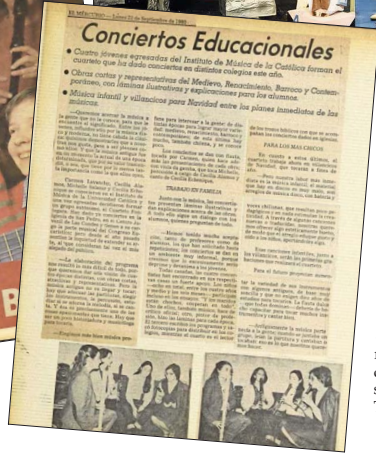
Mazapán y su presencia en “El Mercurio” en los años 80.