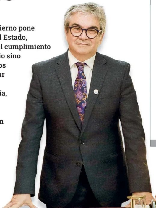
Mario Marcel, ministro de Hacienda

El inicio del último año de Gobierno pone presión a toda la estructura del Estado, obligando no sólo a extremar el cumplimiento de los planes de cada ministerio sino también a priorizar los objetivos principales que busca concretar la actual administración. Las carteras de Hacienda, Economía, Minería, Obras Públicas, Trabajo y Transportes y Telecomunicaciones definieron sus metas para la recta final.