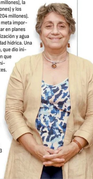
Jessica López, ministra de Obras Públicas.

3. Asociación público-privada. Este año la Dirección General de Concesiones "seguirá acelerando licitaciones de nuestra cartera de proyectos". En línea con el resurgimiento del sistema de concesiones en los últimos dos años, el MOP seguirá impulsando durante el presente ejercicio su cartera de proyectos 2024-2028, que incluye 43 contratos. De ellos, 26 corresponden a iniciativas en las áreas de transporte y edificación públicas, 13 a carreteras, dos a aeropuertos e igual número a infraestructura hídrica.