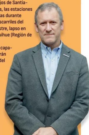
Juan Carlos Muñoz, ministro de Transportes y Telecomunicaciones.

3. Quinta generación y conectividad. Dentro del objetivo de “empujar por más presencia y más competencia en el sector”, el MTT indica que en 2025 comenzará “el despliegue de infraestructura 5G del cuarto actor adjudicatario de la nueva licitación efectuada por nuestra administración”, en referencia al proceso pendiente de WOM. Por otro lado, la cartera destacó que durante el primer trimestre “quedará firmado el contrato entre Google y la empresa pública Desarrollo País para así comenzar la obra y despliegue del cable submarino que conectará nuestro país con Oceanía”.