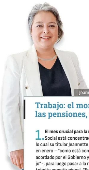
Jeannette Jara, ministra del Trabajo y Previsión Social.