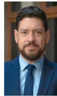
Ministro Alamiro Alfaro del Primer Tribunal Ambiental de Antofagasta.

La firma explicó a los jueces que la vigencia de la Resolución de Calificación Ambiental "no implica de manera alguna la inmediata construcción del proyecto, solo habilita para tramitar el