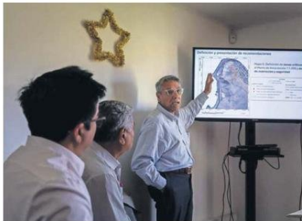
CORPORACIÓN Y MUNICIPIO PRESENTARON PROPUESTA.

Entre las acciones propuestas para esta reapertura, está la creación de un protocolo de funcionamiento de Cuevas de Anzota para asegurar la integralidad del visitante con una uni-