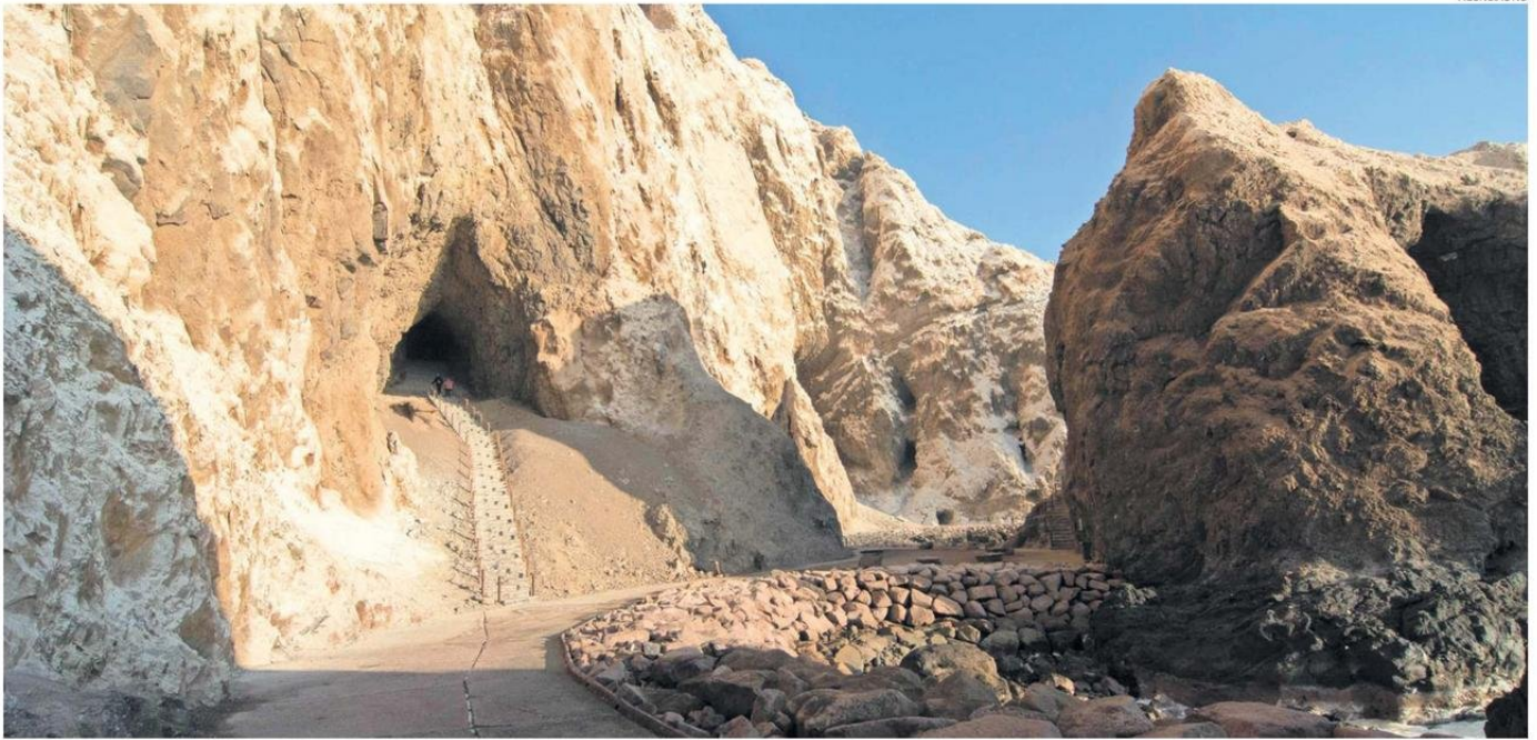
EL RECINTO ADMINISTRADO POR LA CORPORACIÓN COSTA CHINCHORRO SE ENCUENTRA CERRADO DESDE NOVIEMBRE DEL AÑO 2023.