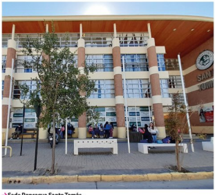
→ Sede Rancagua Santo Tomás.