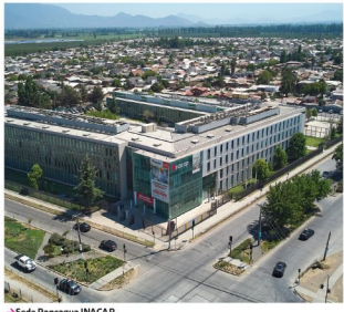
→ Sede Rancagua INACAP

EE en el compromiso • INACAP, y sus centros de estudio