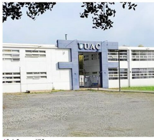
→ Sede Rancagua UAC