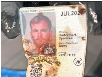
LA POLICÍA de Las Vegas mostró la identificación militar del agresor que encontró dentro del vehículo.

prácticamente “intacto”, afirmó. El FBI dijo que está investigando el hecho como un “posible acto de terrorismo”, que describió como “un incidente aislado”, y que desató todas las alarmas de las autoridades por la proximidad con la asunción de Trump el 20 de enero, y por ocurrir horas después de un atropello múltiple en Nueva Orleans que dejó 14 muertos (ver recuadro).