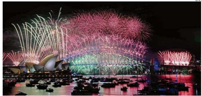
SIDNEY RECIBIÓ EL 2025 CON UN ESPECTÁCULO PIROTÉCNICO COLORIDO.