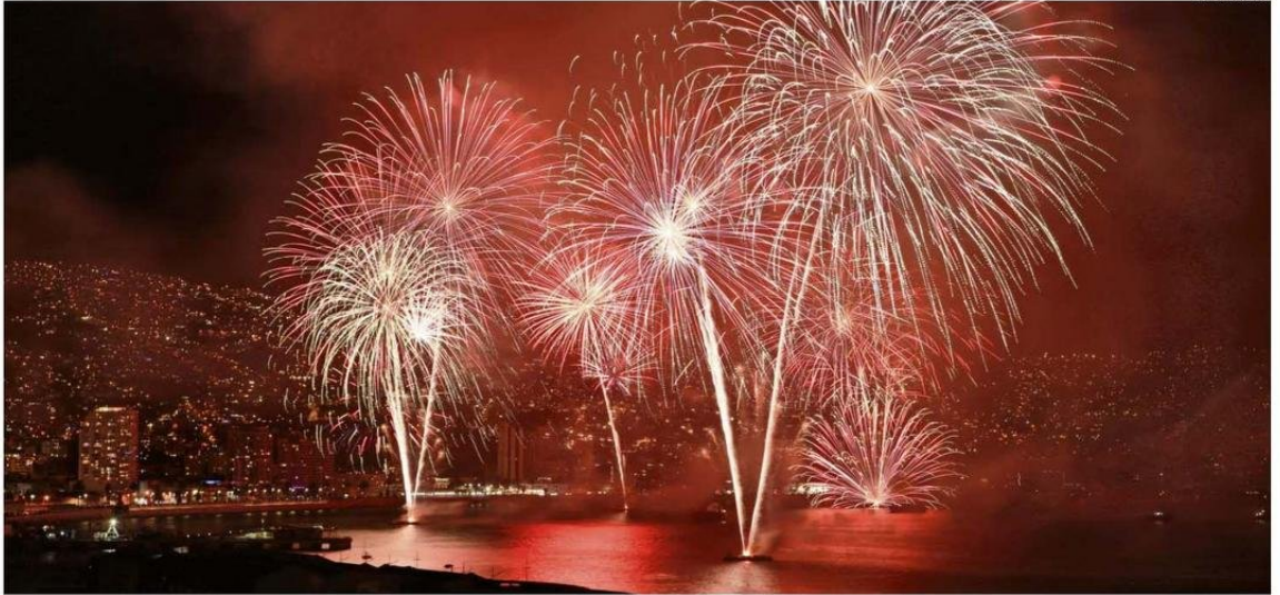
VALPARAÍSO TUVO UN SHOW PIROTÉCNICO DE 18 MINUTOS CON LANZAMIENTOS DESDE DIEZ PUNTOS DISTINTOS DE LA COSTA DE LA CIUDAD PUERTO.

Los drones siguieron ganando terreno en países asiáticos como China, mientras que algunas ciudades chilenas como Iquique también se aventuraron a usar la tecnología. CS