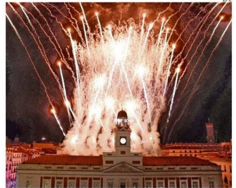
LA PUERTA DEL SOL DE MADRID TUVO SUS FUEGOS ARTIFICIALES.