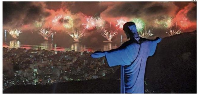
EN RÍO DE JANEIRO, DESDE EL CRISTO REDENTOR SE PUDO APRECIAR EL SHOW EN LA COSTA.