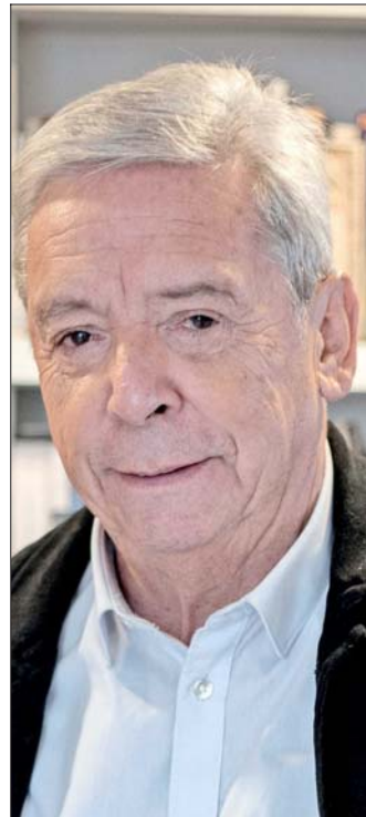
Carlos Ominami, exministro de Economía y exsenador socialista.

fortalecido la cooperación y la interdependencia económica, social y cultural, y se ha promovido el diálogo y la concertación política; se subraya la coordinación entre las Fuerzas Armadas, así como se resalta el Tratado de Maipú (2009).