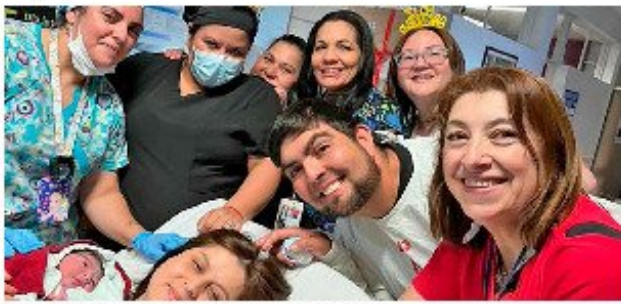
Los padres de Mía junto al equipo médico de San Fernando.