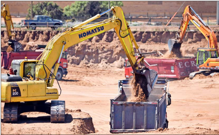
La construcción fue el sector que terminó el año con la menor confianza empresarial. El subindicador se registró en 29,17 puntos en diciembre.

La confianza empresarial registró su peor desempeño del 2024 en diciembre, y acumula casi tres años en terreno negativo.