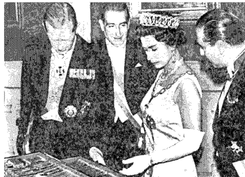
La reina Isabel II le otorgó el título de “sir”. La monarca de Reino Unido visitó Chile en 1968, mientras él estaba como director de protocolo.

no tengo ni una arruga, y eso es porque ni me arrugo con las cosas que pasan en nuestro país. Tengo paciencia, pero insistencia al mismo tiempo, para poder hacer y servir. Ya me han dado bastante en el gusto, porque me han hecho cuantos honores que he podido ver en un ser vivo. Muy atípico en nuestro Chile que, lamentablemente, tiene muchas dosis de envidia en el ambiente. La envidia, aquí, es casi una profesión”. —A las personas se les suele reconocer su aporte cuando ya están muertas. “Por eso los entierros son tremendos. Cada uno trata de hablar lo que se calló durante toda su vida. Yo, en cambio, lo estoy escuchando todo en vida y no creo que haya ninguna dificultad en que me pueda desaparecer fugazmente sin que pase nada mayormente, porque ya todo ha sido hecho y dicho”. —Usted fue director de la Academia Diplomática “Andrés Bello”. ¿Cómo debe ser un diplomático? “El diplomático puede tener muchos títulos, pero sobre todo debe tener una vocación