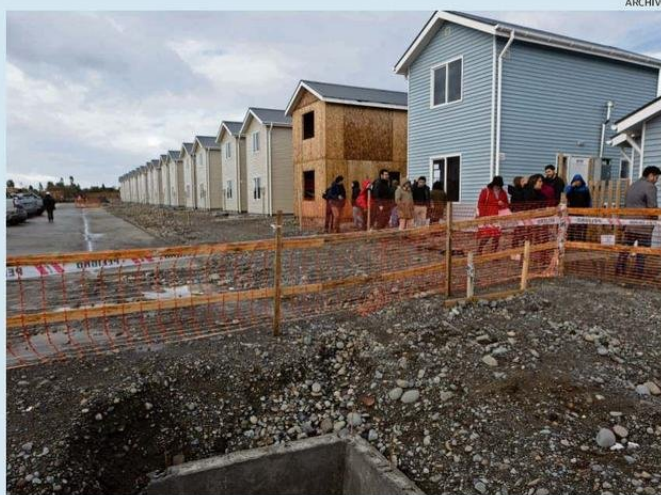
EL AVANCE DEL PLAN DE EMERGENCIA HABITACIONAL, DESTACÓ -ENTRE OTROS- EL SEREMI DE ECONOMÍA.

programa Desarrollo Productivo Sostenible (DPS), "que busca impulsar una matriz productiva más sostenible y sofisticada, mediante la incorporación de mayor conocimiento, innovación y tecnología, hemos financiado diversas iniciativas regionales por más de $4.825 millones".