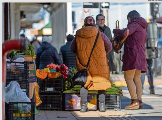
PARA WEIL, SE REQUIERE DE INCENTIVOS ECONÓMICOS PARA REDUCIR LA TASA DE INFORMALIDAD LABORAL.

Entre los aspectos relevantes negativos del año, se centró en la persistencia del alto nivel de economía informal. "La región exhibe un alto grado de actividades ilegales que desregulan el funcionamiento de los mercados locales del trabajo y venta de mercancías. Esta evolución económica y social disfuncional se mantiene elevada y se conso-