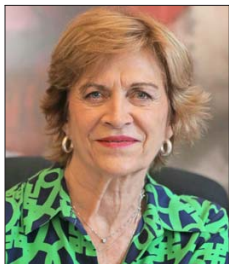
Evelyn Matthei (UDI) , exalcaldesa de Providencia.

El sondeo reveló, además, que el 49% de las personas que respondieron asegura que no les interesan las primarias voluntarias para elegir candidatos de algún sector político que compitan en las presidenciales.