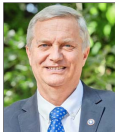
José Antonio Kast , candidato del Partido Republicano.