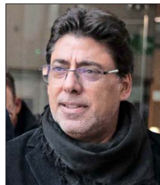
Daniel Jadue (PC) , ex candidato presidencial.

ter — que ha manifestado su interés de competir en las primarias de Chile Vamos — y el diputado Johannes Kaiser, quien está en plena recolección de firmas para constituir un partido que sustente su campaña.