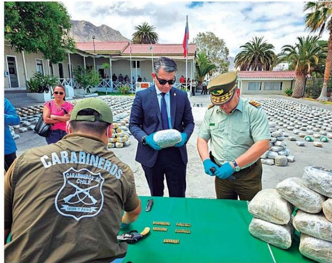
LOS DETENIDOS QUEDARON EN PRISIÓN PREVENTIVA POR LOS 120 DÍAS QUE SE OTORGARON A LA INVESTIGACIÓN.

de marihuana, junto a armas y municiones fueron decomisadas en el procedimiento del OS7. El valor del cargamento oscila entre $20 mil y $36 mil millones.