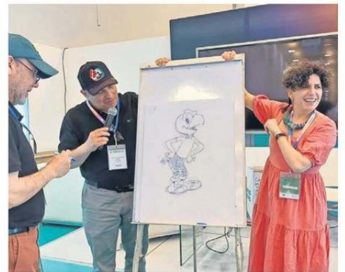
La idea de Stern es poder presentar el libro en Concepción.

"Fue interesante hacer el cruce sobre cómo eran tratados los mismos temas en los diarios de cobertura nacional, más bien de Santiago, y El Sur -por ejemplo- fue una motivación adicional para reivindicar la historia local de Concepción