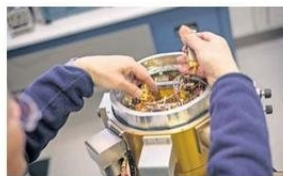
LA REGIÓN PARTICIPA EN CUATRO PROYECTOS